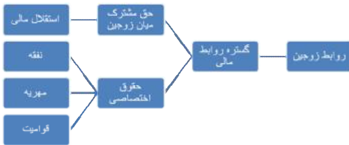
شکل شماره (2)- تهیه و تنظیم از مولف براساس مندرجات

در این پژوهش آیات قرآنی مرتبط با خانواده، استخراج و مطالعه شدند، سپس درگستره‌ی روابط مالی میان زوجین به عنوان مصادیقی از ابداع تشریح عدالت درون‌خانه‌ای، با مراجعه به تفاسیر معتبر به تفکیک مورد شرح و بررسی قرار گرفتند؛ معیار عملیاتی عدالت جنسیتی در تفکر اصیل اسلامی، به صورت تساوی کامل در حقوق انسانی و تفاوت‌های مبتنی بر خصوصیات جسمی، روحی و نقش هر یک از زوجین در خانواده قابل طرح است؛ بدین ترتیب که در هر یک از گستره‌های حق و تکلیف، قانونگذار اسلامی ابتدا یک حق مشترک انسانی را در قالب یک کلیت برای هر دو جنس، صرف‌نظر از نقش‌هایی که به عنوان زن و شوهر در خانواده بر عهده دارند، به رسمیت شناخته و در احکام جزئی‌تر، حقوق و تکالیف اختصاصی متناسب با ویژگی‌های هر یک از زوجین را معرفی و تبیین نموده است (نمودار 2).