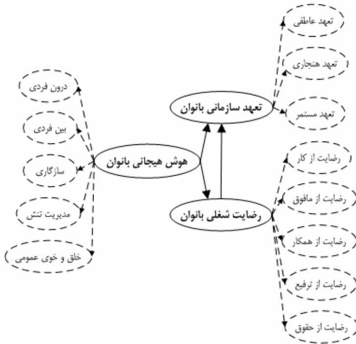
شکل 1- مدل مفهومی تحقیق

ترکیبی استفاده شده است. برای تحلیل داده ها از روش مدلسازی معادلات ساختاری واریانس محور استفاده شده است. شکل زیر مدل مفهومی تحقیق را نشان می دهد: